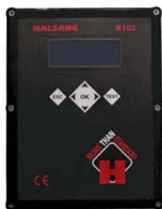
Elskåp med en Halsang H102-styrenhet och frekvensmodulatorer