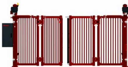
Varmförzinkad – dubbel vikgrind