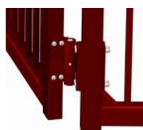
Gångjärn som klarar upp till 400 kg.